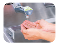
液状の石けんが吐出。

広くて使いやすいデザイン 快適な手洗いにこだわり、ノズル下の空間を広くしたデザイン。