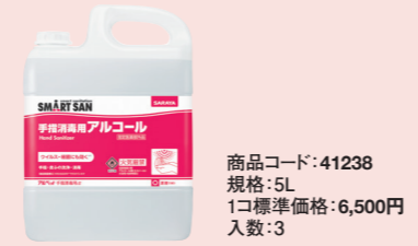
商品コード: 41238 規格: 5L 1コ標準価格: 6,500円 入数: 3

手指消毒用アルコール アルベット手指消毒用α 指定医薬部外品 原液 液状 火気厳禁 PRTR制度対応品 ノンエンベロープウイルスを含む幅広いウイルス・細菌に効果的。食品取扱者の手指消毒に最適。有効成分:エタノール71.8W/w%(76.9~81.4vol%)