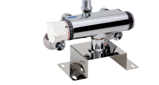
床置型混合水栓用 商品コード: 46743

混合水栓を床面へ取り付ける場合に。※写真は混合水栓取り付け時のものです。商品には混合水栓は含まれません。