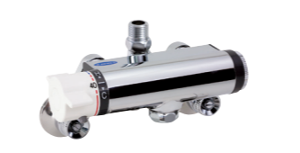
壁付型 商品コード: 46748

ハンドル操作で、温度調節が可能です。※混合水栓自体に給湯機能はありませんので、別途ご用意願います。※改装工事などの場合は、設置環境に応じて、別売のブラケットと組み合わせる場合があります。