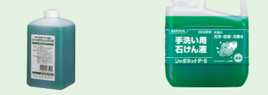
商品コード: 23340 規格: 1L 機器用 1コ標準価格: 910円 入数: 10 商品コード: 30827 規格: 5kg 1コ標準価格: 3,400円 入数: 3

手洗い用石けん液 シャボネットP-5 医薬部外品 無香料 PRTR制度対応品 フレッシュシトラスグリーンの香り。手洗いと同時に殺菌・消毒ができます。泡状または液状で吐出します。