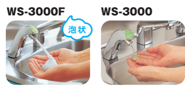
WS-3000F 泡状の石けんが吐出。 WS-3000 液状の石けんが吐出。