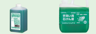
商品コード: 23337 規格: 1L 機器用 1コ標準価格: 1,000円 入数: 10 商品コード: 30828 規格: 5kg 1コ標準価格: 3,400円 入数: 3

手洗い用石けん液 シャボネットユ・ムP-5 医薬部外品 無香料 PRTR制度対応品 香料無添加。手洗いと同時に殺菌・消毒ができます。泡状または液状で吐出します。