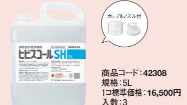
商品コード: 42308 規格: 5L 1コ標準価格: 16,500円 入数: 3

速乾性手指消毒剤 ヒビスコールSH (指定医薬部外品) 原液 液状 火気厳禁 PRTR制度対応品 広範囲の微生物に対して迅速かつ持続的な消毒効果を発揮する無色のエタノール溶液です。手荒れ防止に配慮。有効成分:クワルヘキシジメチルコニ酸塩0.1W/v% エタノール濃度:72.3W/w%(約79vol%)