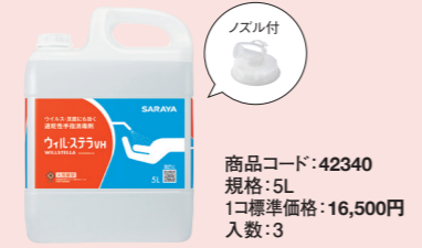
商品コード: 42340 規格: 5L 1コ標準価格: 16,500円 入数: 3

速乾性手指消毒剤 ウィル・ステラVH 指定医薬部外品 原液 液状 火気厳禁 PRTR制度対応品 ノンエンベロープウイルスを含む幅広いウイルス・細菌に作用する手指消毒剤です。手荒れに配慮。有効成分:エタノール76.9~81.4vol%