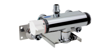
壁付型混合水栓用 商品コード: 46742

混合水栓を壁面へ取り付ける場合に。※写真は混合水栓取り付け時のものです。商品には混合水栓は含まれません。